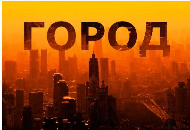
Рис.3. Обтравочная маска